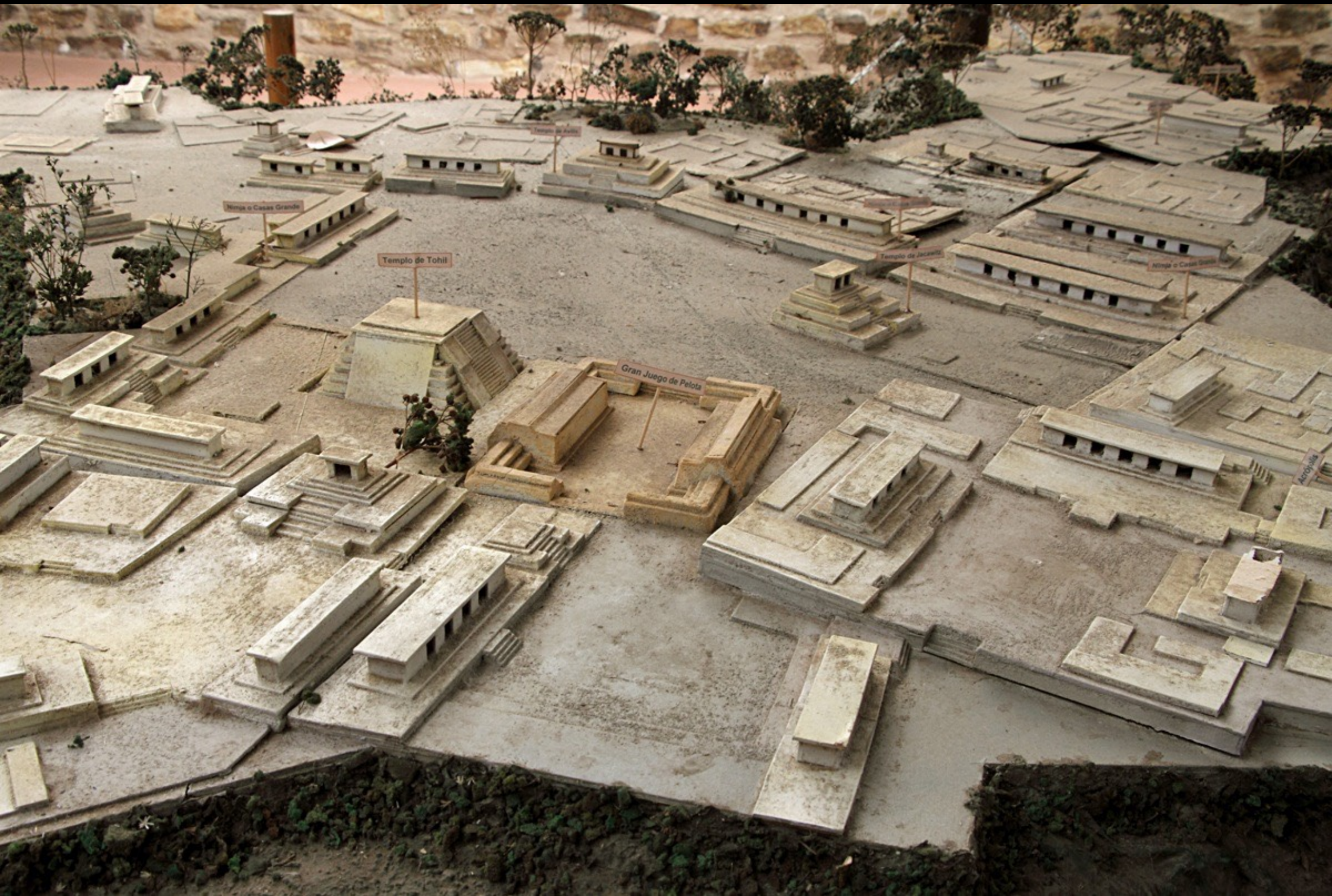
Q'umarkay (Ort der alten Schilfbündel), Santa Cruz del Quiché