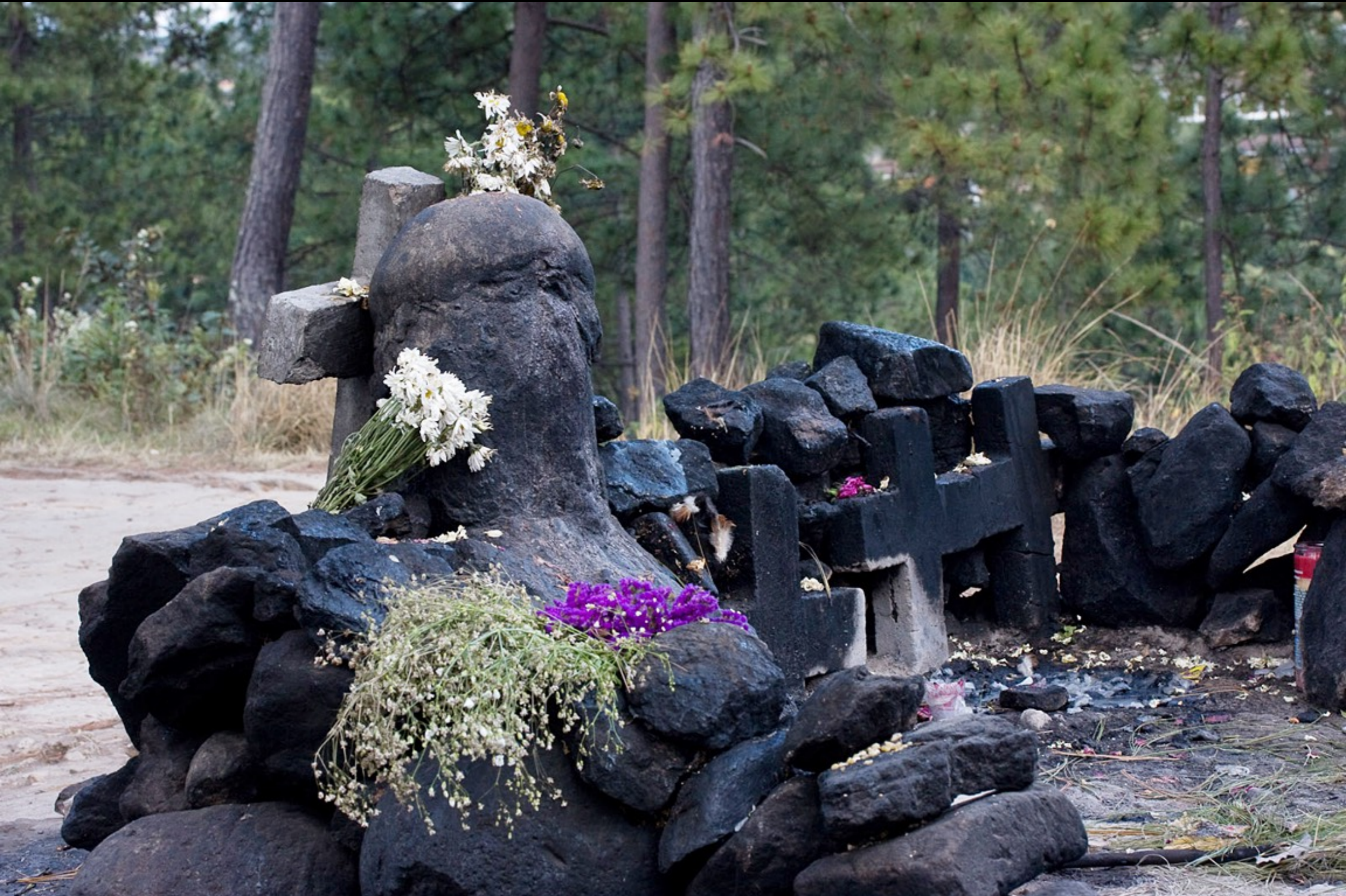
Pascual Abaj: el dios Abaj es un dios maya de la tierra, de la fertilidad y de la lluvia.