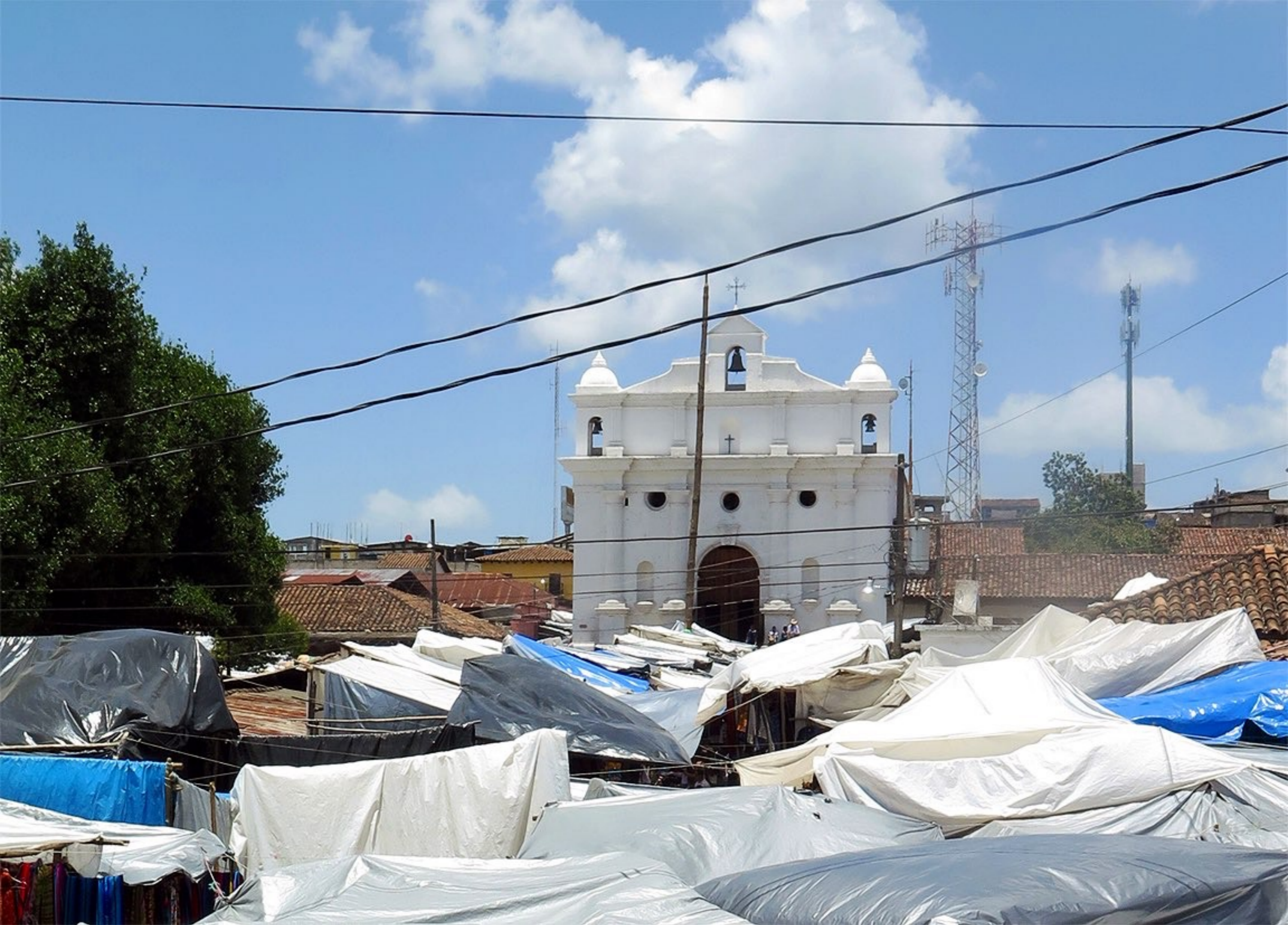
Iglesia de Santo Tomás