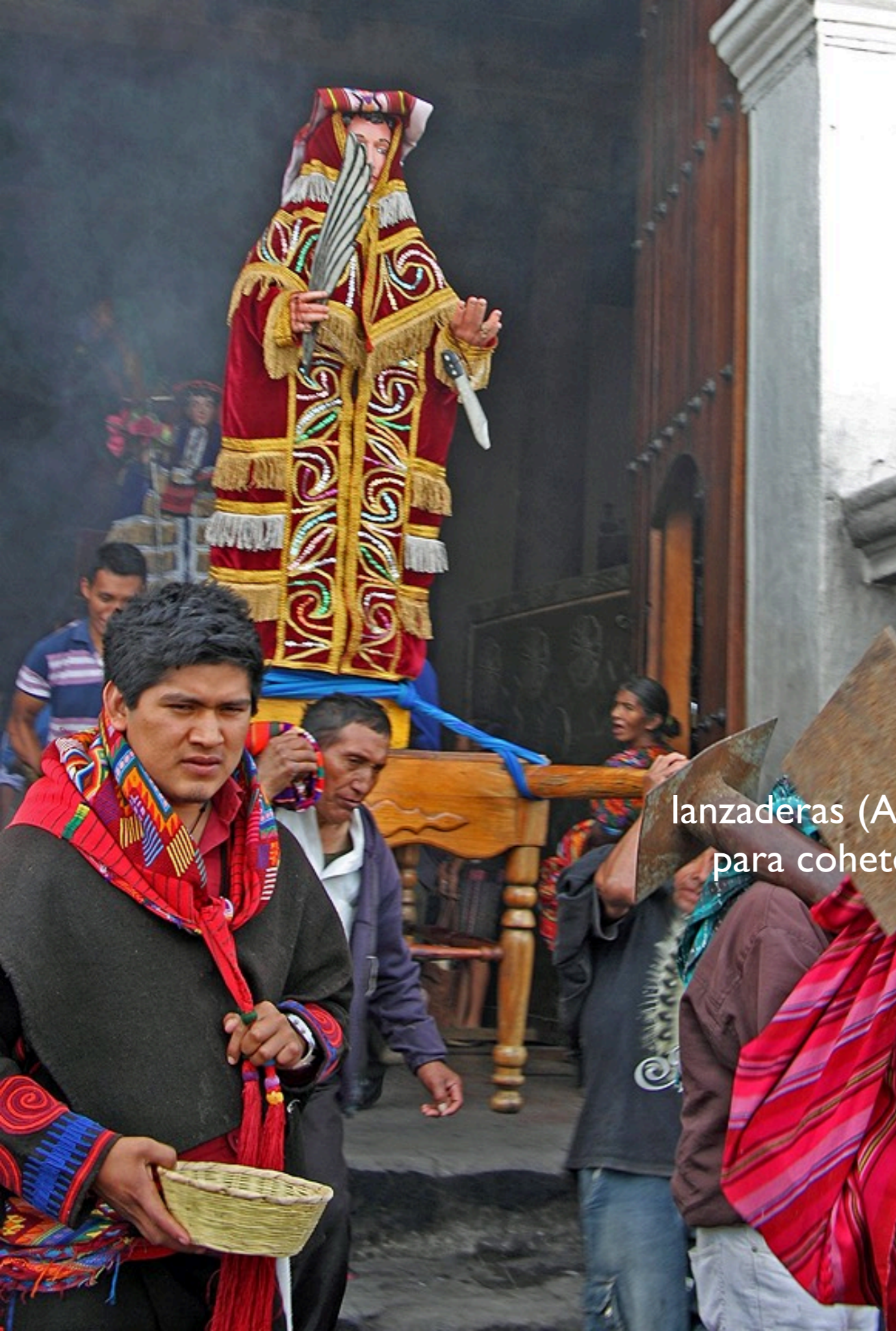
lanzaderas (Abschussrampen) para cohetes o „bombas“