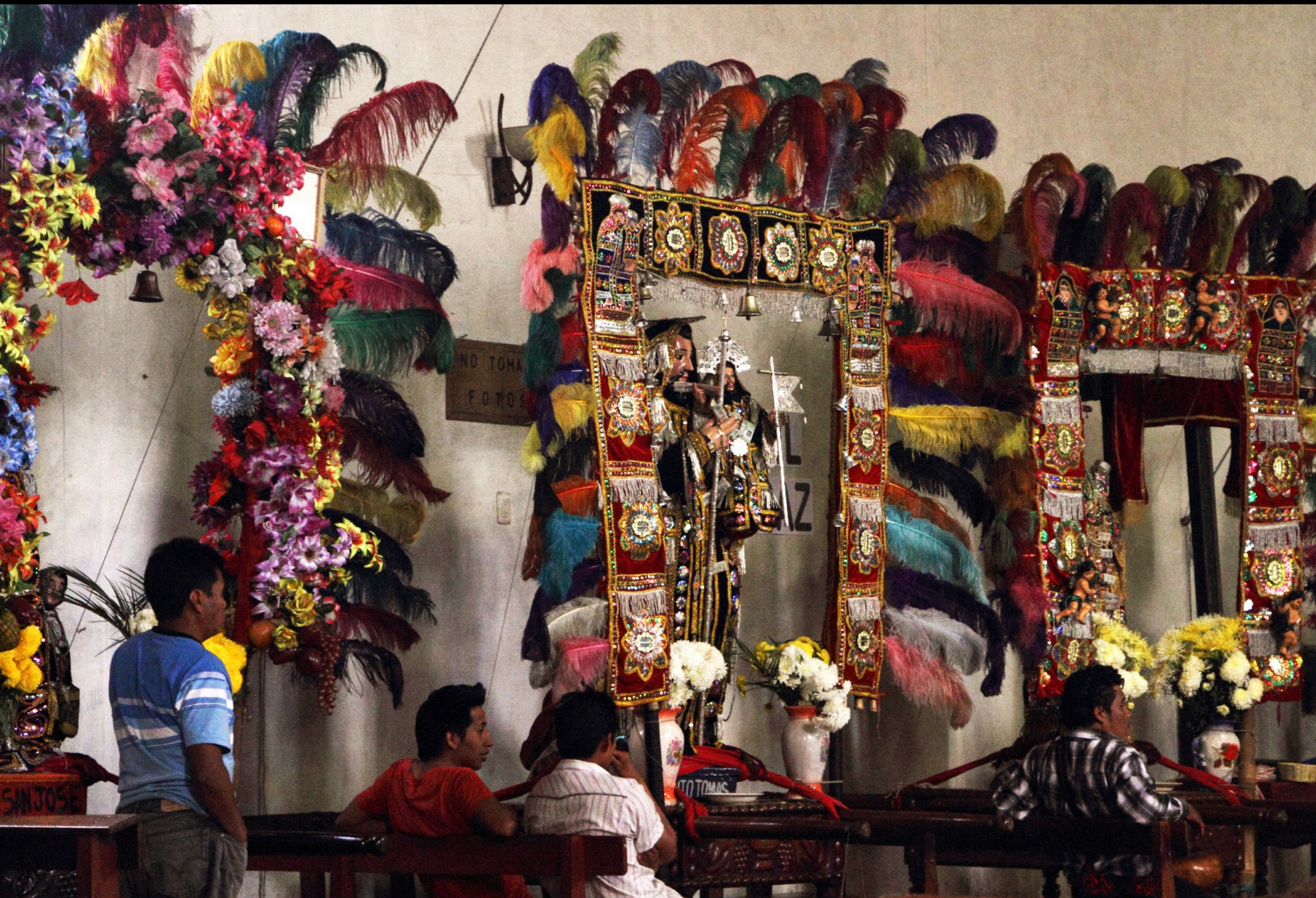
Hay catorce cofradías; cada una tiene su escultura sagrada o „imagen“ (interior de Santo Tomás)