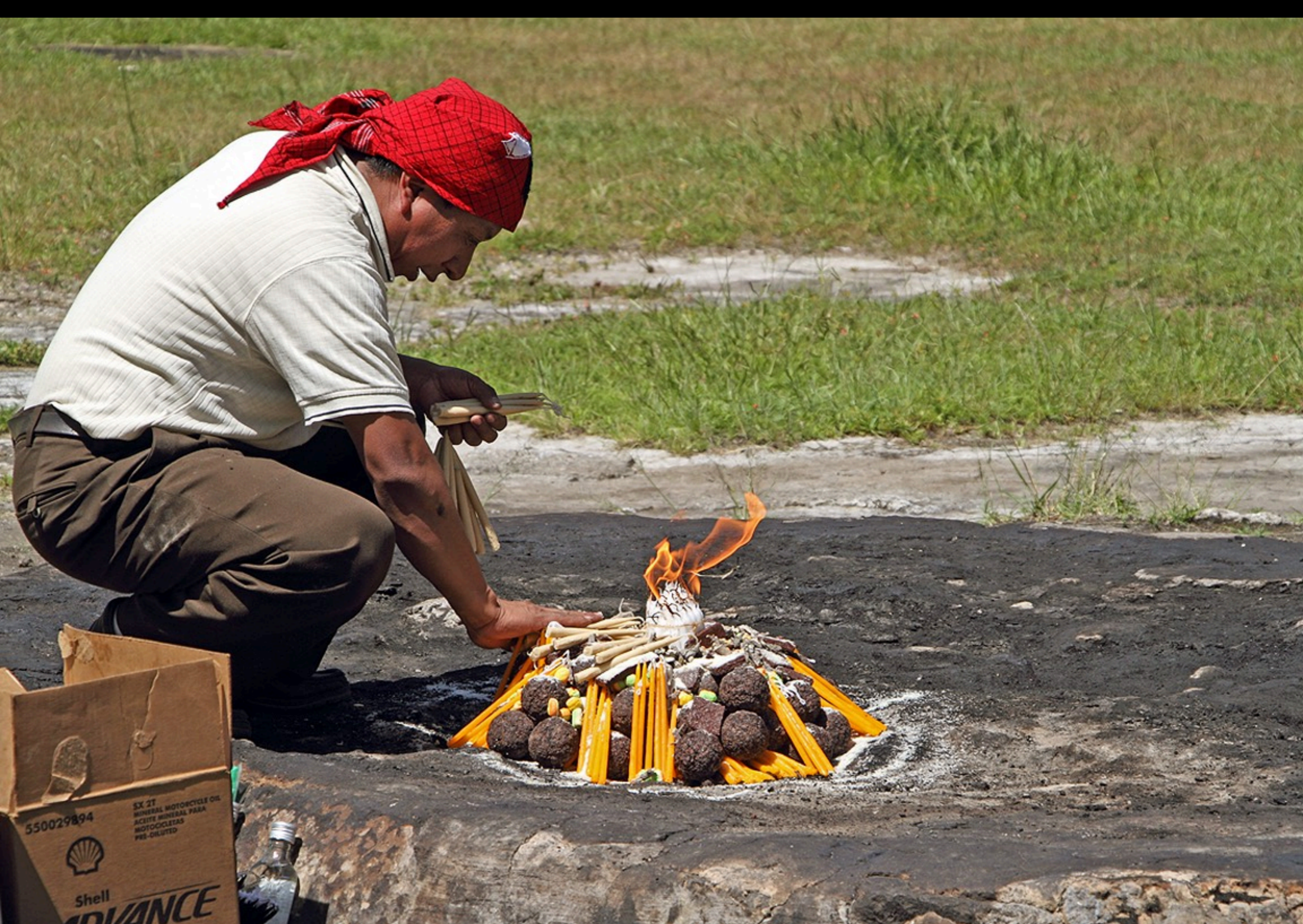
Q'umarkay (Ort der alten Schilfbündel), ritual indígena