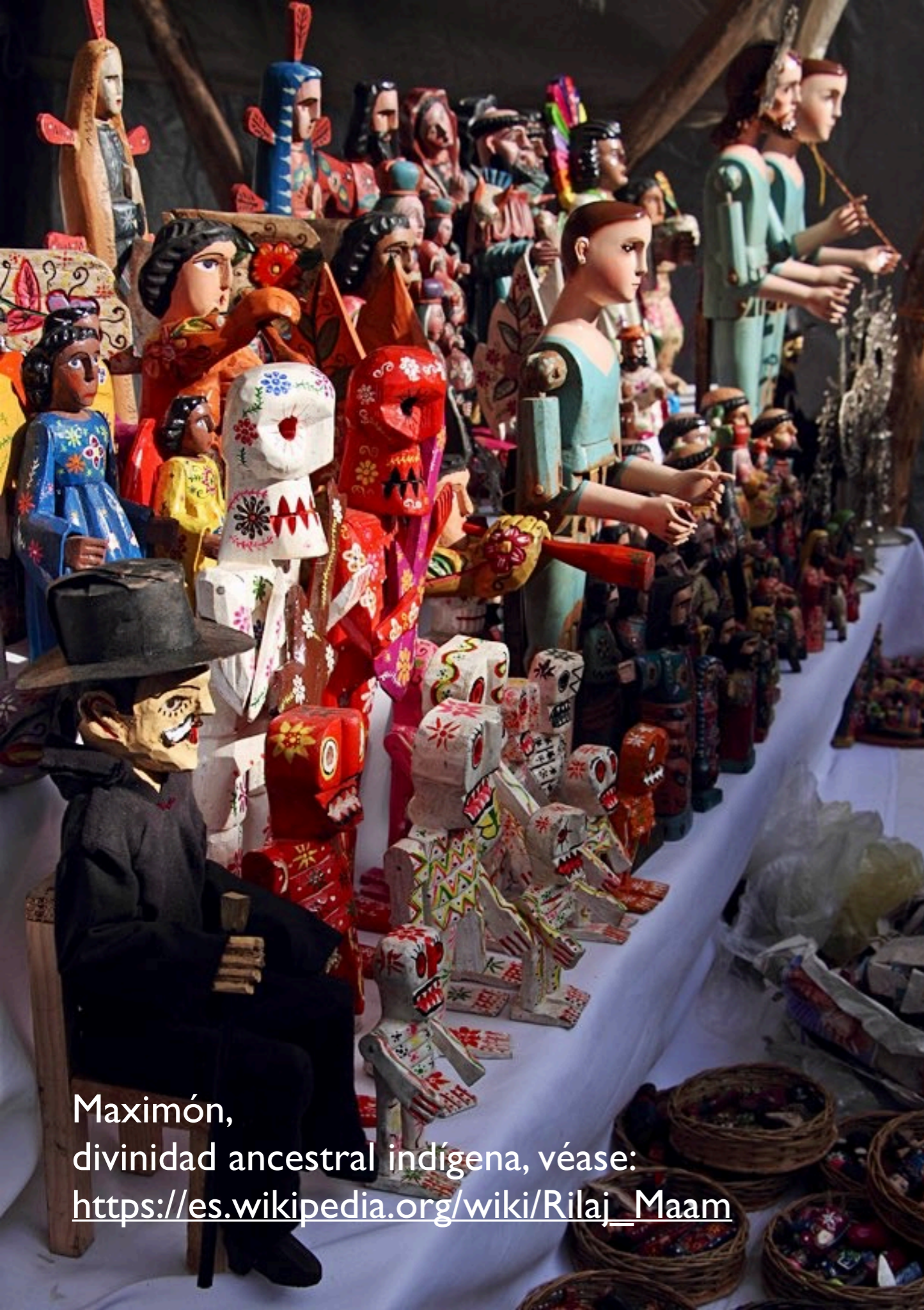
Maximón, divinidad ancestral indígena, véase: https://es.wikipedia.org/wiki/Rilaj_Maam