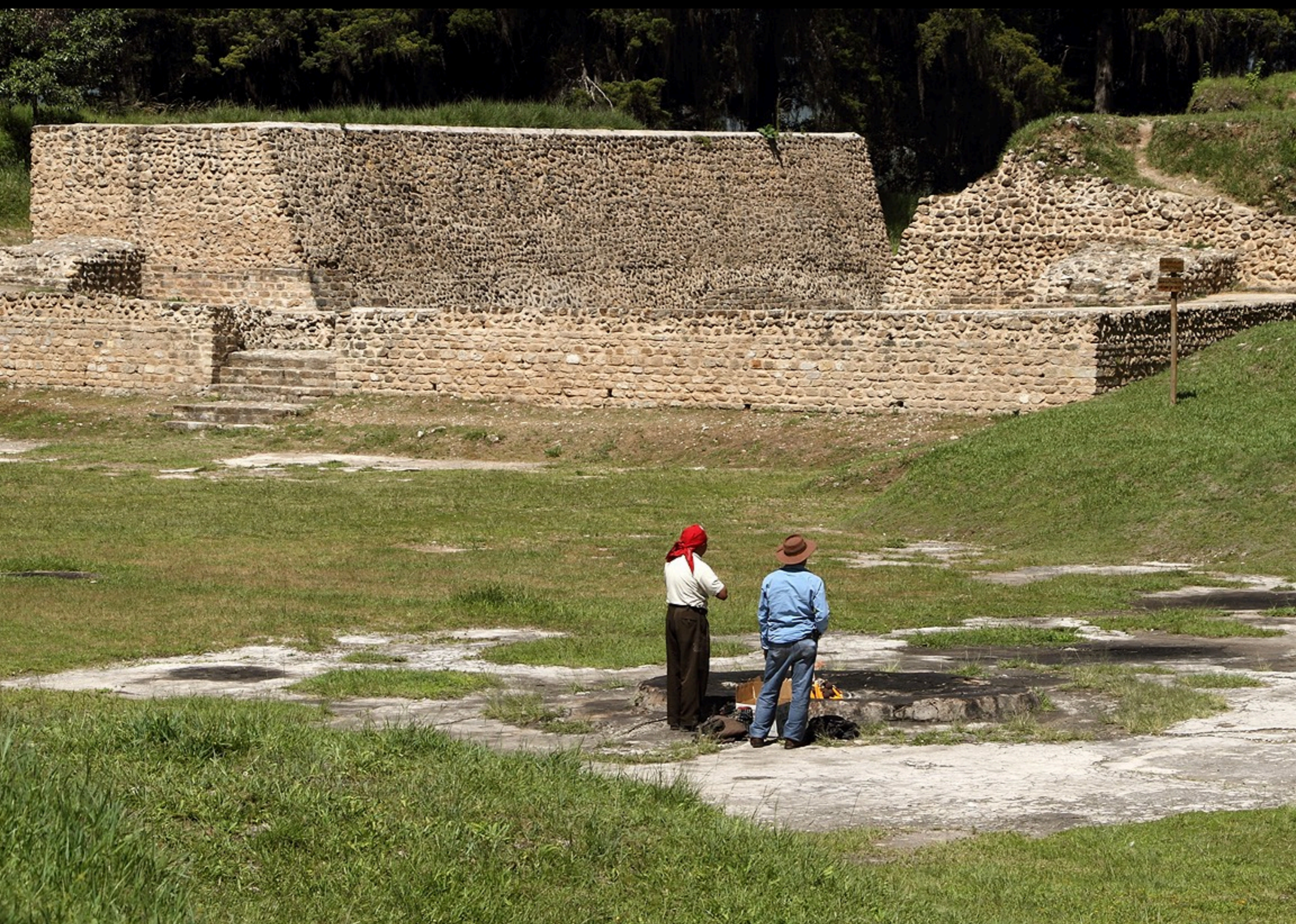
Q'umarkay, la cancha de pelota tiene que haber sido reconstruida