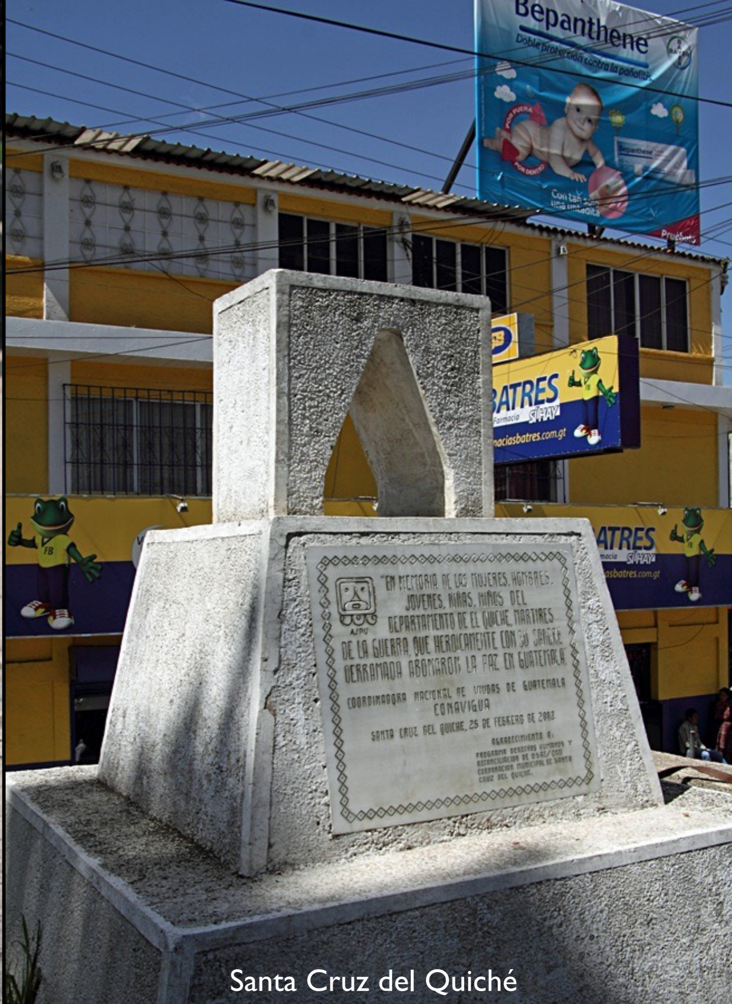
Santa Cruz del Quiché